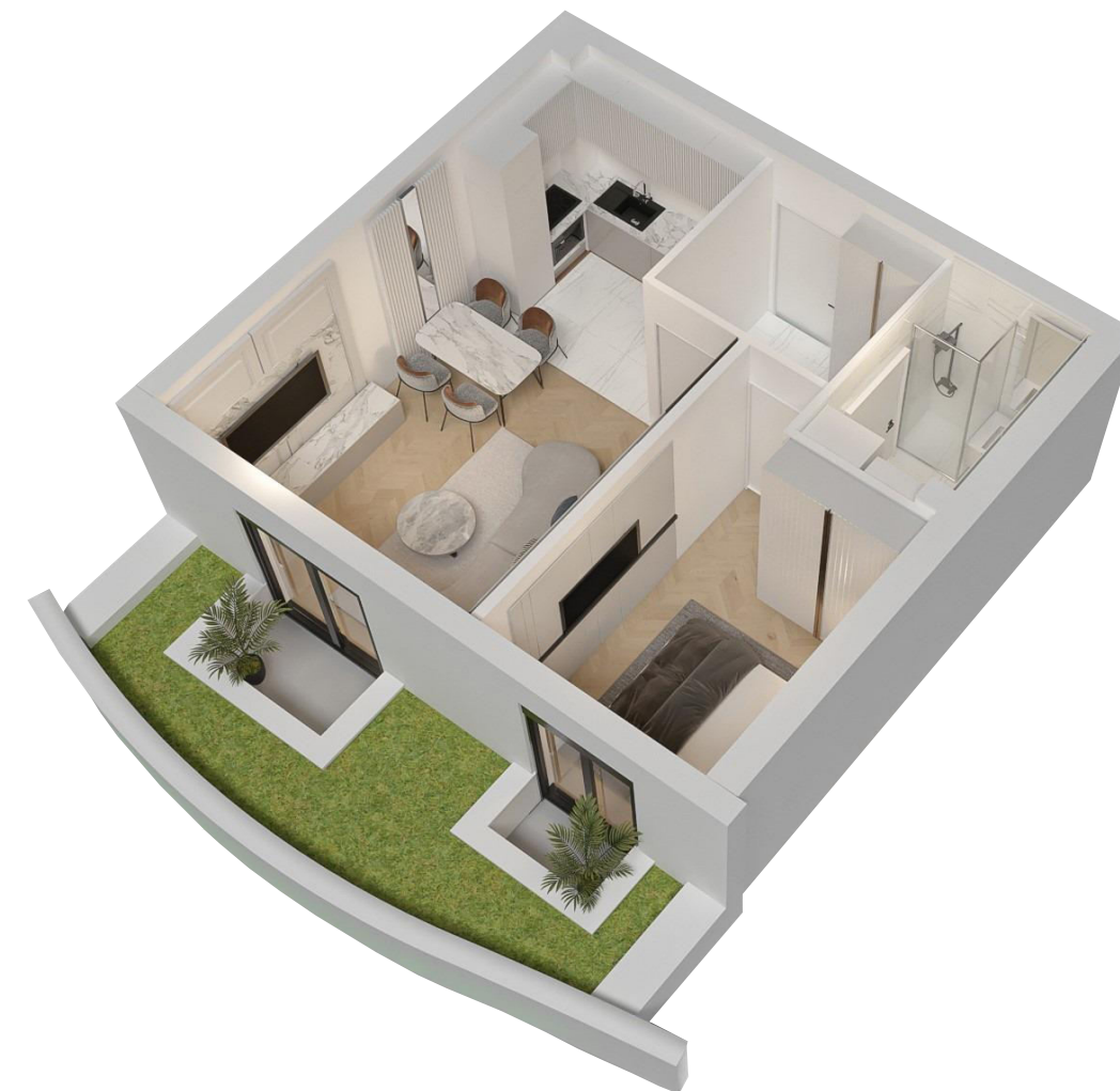
3D MODEL STANA